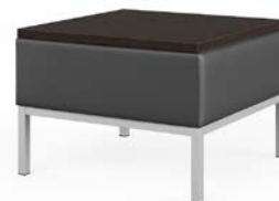
пуф со столешницей